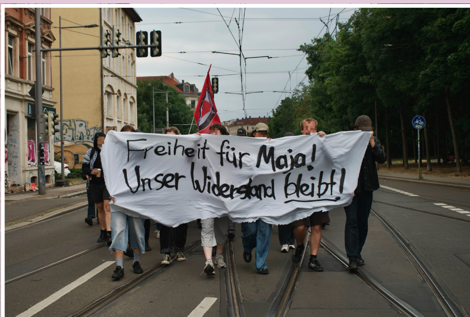
Demonstration zur Hausbesetzung in Solidarität mit Majas Hungerstreik vom 15. Juli 2025 in Leipzig.