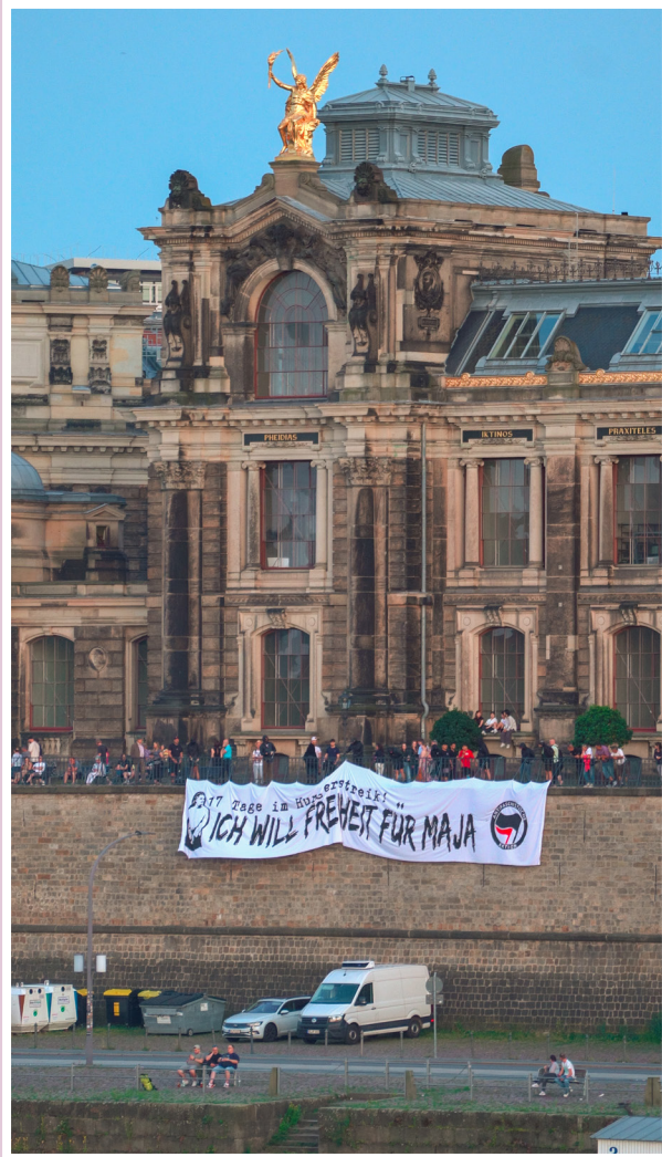
Am 21. Juni 2025 befestigen Aktivist:innen in Dresden ein Banner mit der Aufschrift „17 Tage im Hungerstreik. Ich will Freiheit für Maja“ am Geländer der Brühlschen Terrasse.