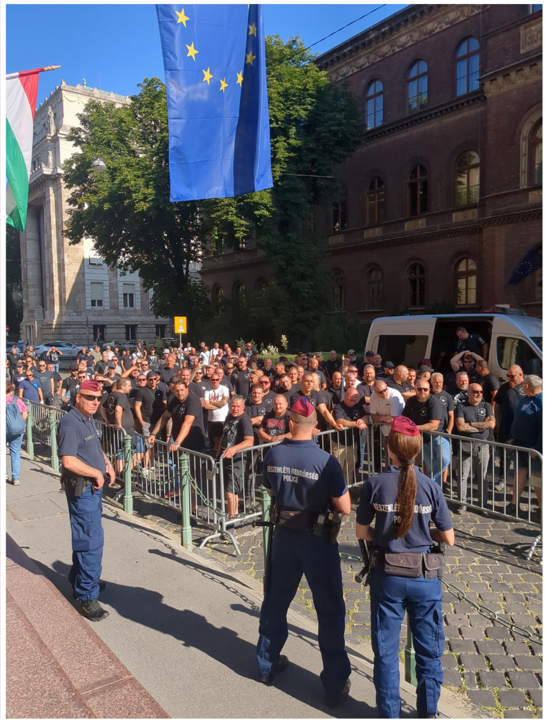
Neonazi-Kundgebung vor dem Budapester Gericht am Verhandlungstag vom 20. Juni 2025.