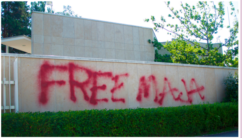
Großes Graffiti an der deutschen Botschaft in der finnischen Hauptstadt Helsinki am 15. Juli 2025.