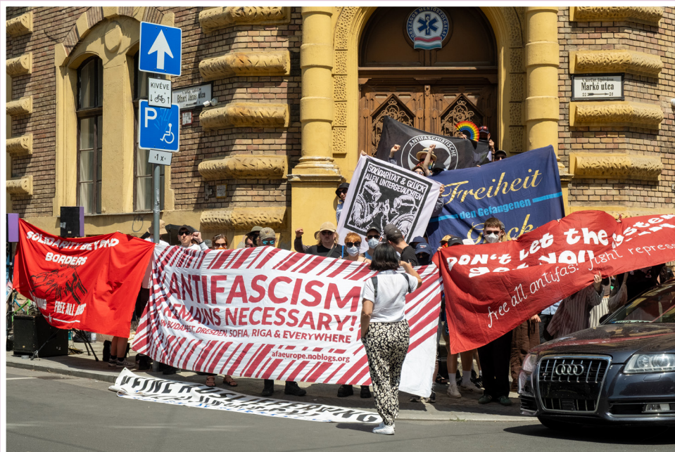
Solidaritätskundgebung vor dem Budapester Gericht anlässlich einer Gerichtsverhandlung im Strafverfahren von Maja am 6. Juni 2025, dem zweiten Tag von Majas Hungerstreik.