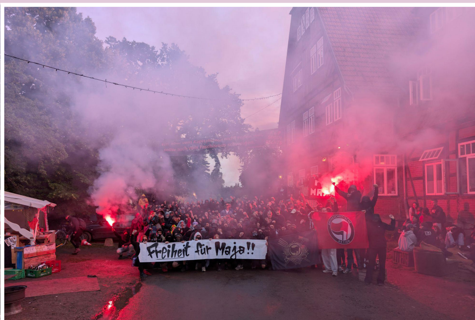
Solidaritätsbild von der Kulturellen Landpartie im Wendland vom 8. Juni 2025.