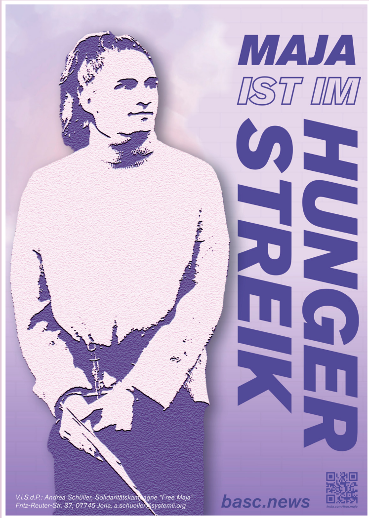
Poster aus dem Aktionskit des Soli-Komitees vom 5. Juni 2025.