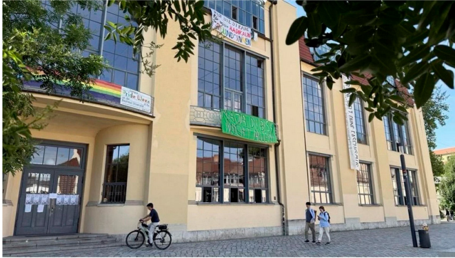
Protest an der Bauhaus-Universität Weimar: Aktivisten besetzen die Uni. Sie fordern die Leitung dazu auf, sich für Maja T. einzusetzen.

Die Thüringer Allgemeine schreibt am 4. Juli 2025 über die politische Debatte, die die Besetzung der Bauhaus-Universität in Weimar für Maja ausgelöst hat.