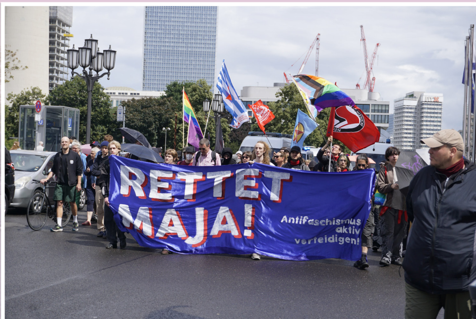
Demonstration im Rahmen des „Rettet Maja“ Aktionscamps vom 13. bis 20. Juli 2025 am Auswärtigen Amt in Berlin.